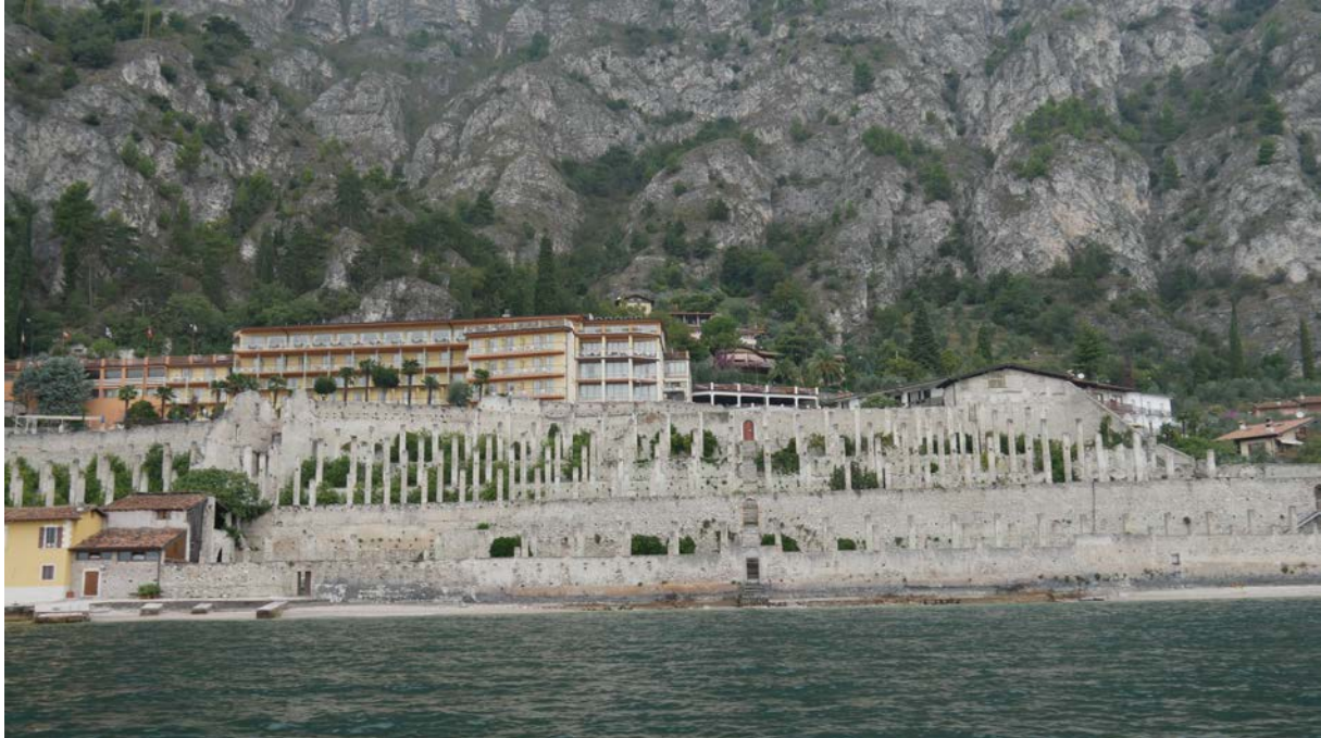
Zitronengärten von Limone